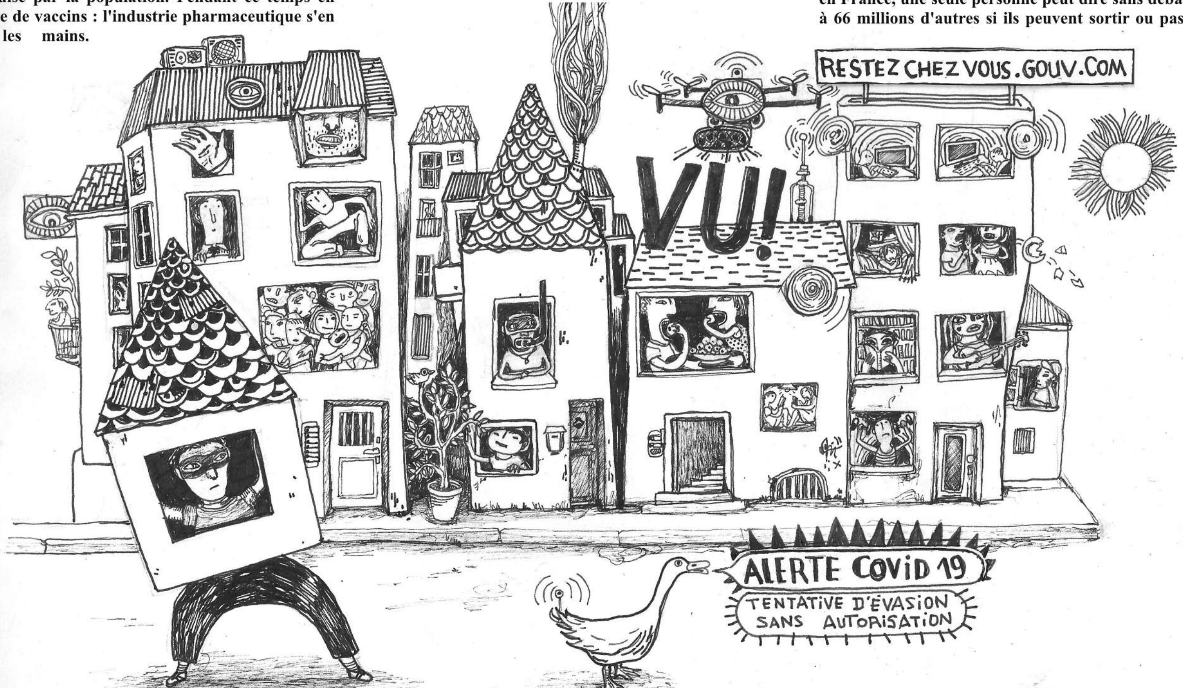
MÉFIEZ VOUS DES IMITATIONS : ATTENTION ! Malgré leurs ALLURES SYMPATHIQUES, LES PALMIPÈDES PEUVENT S'ANÉTER ÊTRE DES AGENTS DE SURVEILLANCE CONNECTÉS AUX PLUS HAUTES AUTORITÉS.