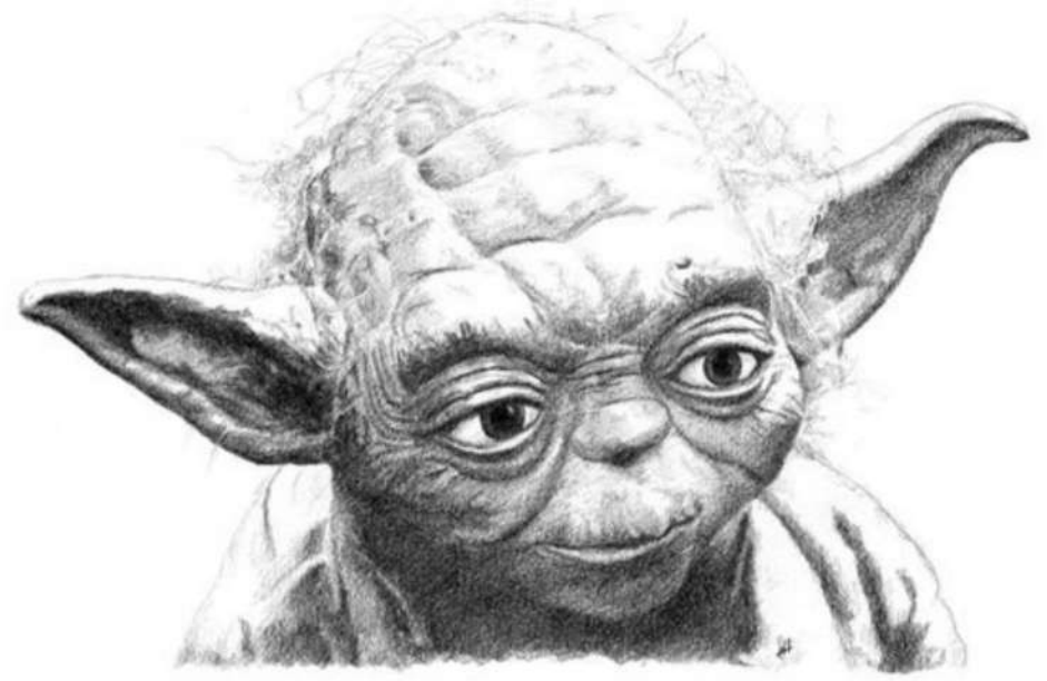
"La peur est le chemin vers le côté obscur." Yoda

Parution quand il y a une raison Prix libre mais pas gratuit Fanzine à lire et à afficher Ou pour allumer un feu